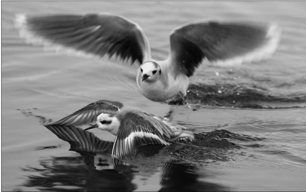
Une Mouette pygmée houspille un Phalarope à bec large . Les deux espèces ont connu un afflux remarquable suite aux forts coups de vent du début d'hiver (Capbreton).

Vieille-Saint-Girons, dernier le 27/03 à Capbreton (STi). A l'intérieur des terres, un individu est observé le 19/08 à Puydarrieux (P. Gonzalez), date précoce. Puis, retour de l'espèce le 8/09 à Capbreton (FCa).