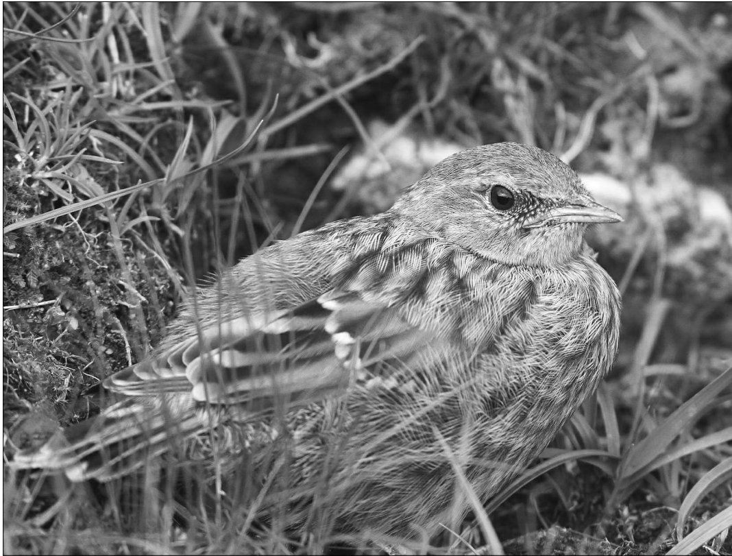
Jeune Accenteur alpin fraîchement sorti du nid, début juillet, à La Pierre-Saint-Martin.