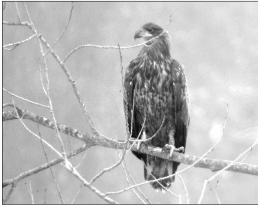
Pygargue à queue blanche de 2 e année porteur d'une bague (origine : Allemagne de l'Est), ayant séjourné à Saint-Martin-de-Seignanx.

second individu) est observé le 4/03 à Rivière-Saas-et-Gourby (STi) et le 5/03 à Léon (PLe, RNN Huchet).