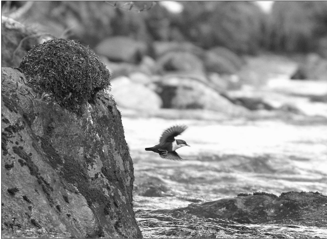
Un Cincline plongeur s'envole de son nid posé sur un rocher du gave d'Aspe, à Borce.