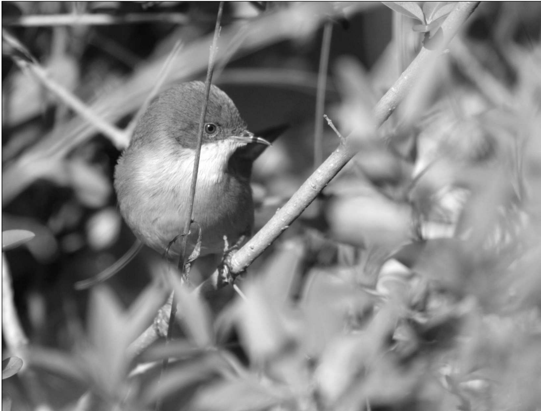
Depuis une première reproduction en 2004 à Tarnos, la Fauvette mélanocéphale - ici un oiseau de Capbreton, s'est solidement implantée sur les arrières-dunes littorales du sud des Landes.

repérée en 2009, se sont avérées négatives (STi). En période de reproduction, 4 chanteurs à Ondres le 16/04 (FCa, STi), 2 à Urrugne le 18/04 (FCa) et 2 à Tarnos le 6/05 (ANe) ; jusqu'à 10 individus le 18/07 à Capbreton (STi).