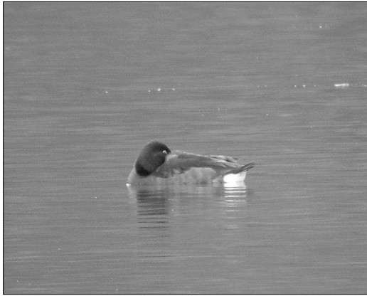
Le Fuligule nyroca est devenu régulier ces derniers hivers, à l'unité ou par paire.

dès l'été : Orx le 19/07 (JIG), Irún les 3 et 12/08 (AHG), Bézingrand le 06/09 (SDu).