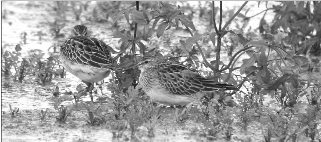
Bécasseaux tachetés observés à Momas le 01/10. Un troisième individu a été vu à Domezain. Régulière en France, l'espèce y est observée annuellement ; les oiseaux présents sur la façade atlantique ont certainement une origine nord-américaine.