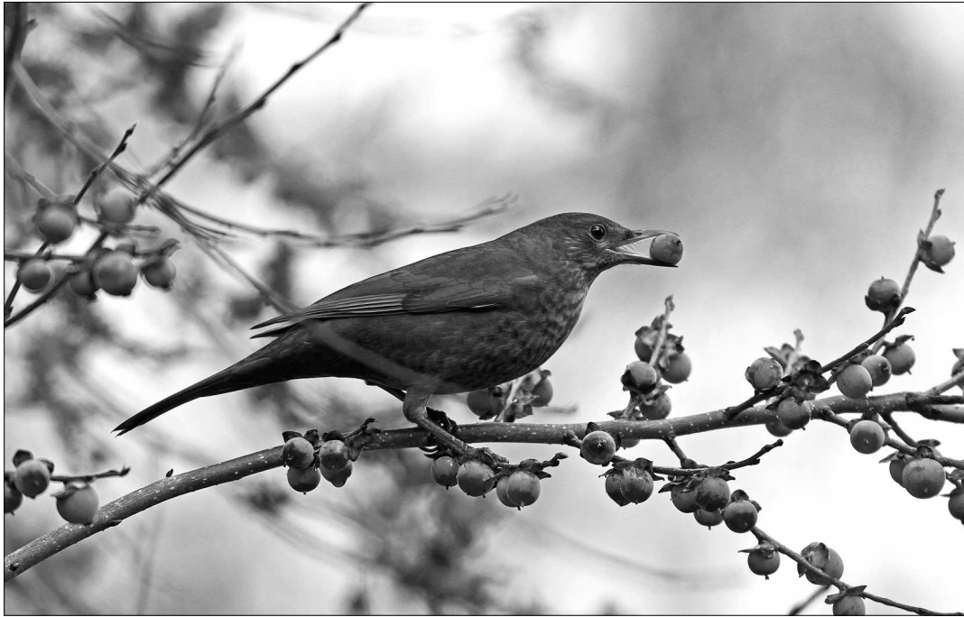
Les observations de Merle noir à 1520 m à Lées-Athas et 1600 m aux Eaux-Bonnes représentent la limite supérieure de l'espèce en période de reproduction dans les Pyrénées occidentales.

teurs sur 500 m linéaires à Bazillac le 28/02 (ALe) et 3 sur 800 m linéaires à Biarritz le 2/04 (ANe), seules données d'intérêt reçues pour l'espèce en 2010, tout comme les années précédentes. L'espèce est observée à Agos-Vidalos le 14/10 (CHO). Au camp de baguage de Villefranche, 155 individus ont été capturés (PFo et al. ).