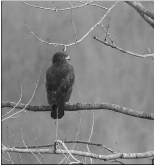
Aigle criard à Saint-Martin-de-Seignanx : une tradition d'hivernage s'est développée sur ce site du sud-ouest des Landes depuis la décennie 1990.

observées les 1/04 à Lacq (STi), 3/04 à Meillon (JIG) et 27/04 à Morcenx (PUT). Migrateurs postnuptiaux à partir du 17/08 au col de Soulor (JFP) avec un maximum de 13 individus le 19/09 sur ce site (JIG).