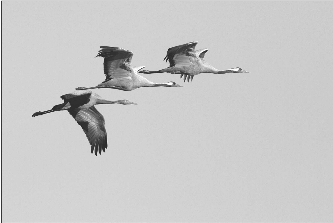
Le développement de l'hivernage de la Grue cendrée se poursuit dans notre région avec des effectifs grandissants à Saint-Martin-de-Seignanx.

(GLa), Saint-Laurent-de-Gosse (PLe), Orx (ANe) et au Courant d'Huchet (PLe-RNN Huchet).